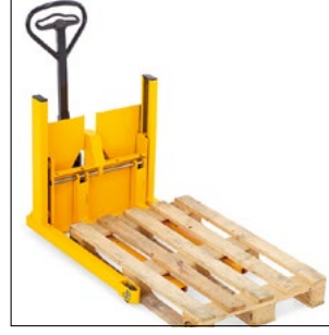
Standart bir Euro paletinin alınması