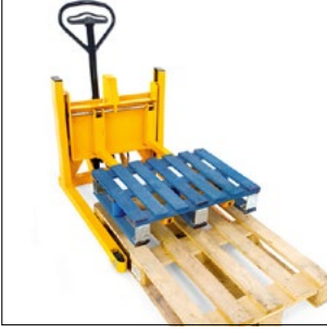
Standart bir Euro palet üzerinden bir yarım paletin alınması